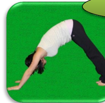
chien tête en bas

Se coucher par terre. Pousser avec les bras afin de lever son torse. Les bras sont droits. Tenir son corps en ligne droite pendant trois respirations. Ne pas laisser tomber les hanches. Pour terminer, déposer les genoux au sol.