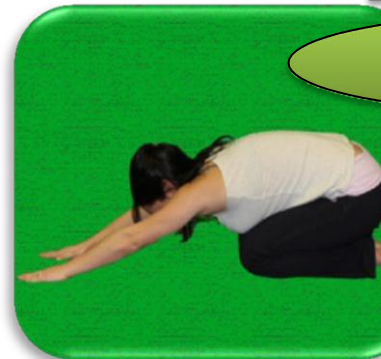
Pose de l'enfant

Prendre la position de la planche . Lever les fesses vers le plafond en redressant les jambes et inspirer. Les jambes et les bras doivent être droits. Le corps est en forme de «V» à l'envers. Bien respirer et reposer la tête.